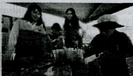
INTERÉS LEGAL. Pobladores acudieron a informarse.

La concurrida actividad se realizó en la Plaza Umachiri del distrito de Mariano Melgar y contó con la participación de instituciones como el Ministerio Público, Indecopi, Sunat, Sunarp, Defensoría del Pueblo, Beneficencia Pública, Fuerzas Armadas, entre otras.